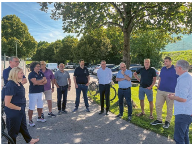
Verbandsvorstand beim Besuch des Sportkompetenzentrums in Schaan.