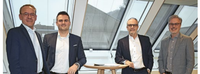
Vertreter von LLB und Wirtschaftskammer im partner-schaftlichen Austausch.

Neben der politischen Interessenvertretung bietet die Wirtschaftskammer ihren Mitgliedern umfassende Dienstleistungen an. Die interne Rechtsberatung wird von den Betrieben rege genutzt und unterstützt sie bei rechtlichen Fragestellungen im Arbeits-, Vertrags- und Wirtschaftsrecht. Ergänzend dazu wird der online Mitgliederbereich laufend weiterentwickelt und ausgebaut. Dieser bietet den