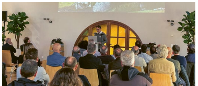
Rund 80 Gäste aus Bauwirtschaft, Verwaltung und Planung verfolgten die Fachvorträge und nutzten die Gelegenheit zum Austausch.