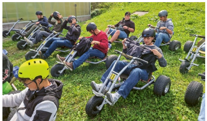
Teilnehmende des Sektionsausflugs beim actionreichen Rahmenprogramm mit Mountainscarts.

Am 12. November lud der Holz Dach Verband seine Mitglieder, Lernenden und Ausbilder zu einem gemeinsamen Ausflug ein. Rund 20 Teilnehmende erlebten einen abwechslungsreichen Tag mit der Besichtigung von Uffer Holzbau in Savognin. Ergänzt wurde das Programm durch ein attraktives Rahmenangebot mit einer Fahrt auf der Funsportstrecke Somtgant–Tignas–Savognin und einer anschliessenden Abfahrt auf der anspruchsvollen Route mit Mountainscarts.