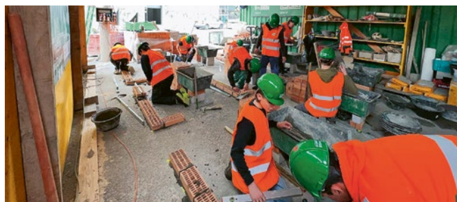
Schülerinnen und Schüler erhalten im Rahmen der BerufsCHECK-Woche praxisnahe Einblicke in handwerkliche Berufe.