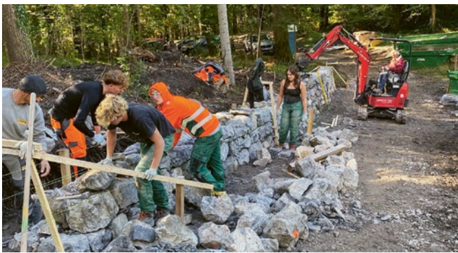
Lernende beim Bau der Trockensteinmauer in Vaduz – ein praxisnahes Ausbildungsprojekt, bei dem handwerkliches Können und Teamarbeit im Mittelpunkt standen.

Ein gelungenes Beispiel für die praxisnahe Ausbildung bot das Lehrlingsprojekt des Baumeisterverbands, bei dem Lernende während mehrerer Wochen eine Trockensteinmauer in Vaduz errichteten. Dabei konnten sie ihr handwerkliches Können anwenden und gleichzeitig wichtige Kompetenzen wie Teamarbeit, Selbstständigkeit und Verantwortungsbewusstsein stärken. Das Projekt zeigte eindrücklich, wie Berufsbildung mit ökologischen Aspekten verbunden werden kann.