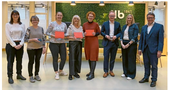
Die Übergabe der fünf Hauptpreise fand im Rahmen einer kleinen Feier im Hauptsitz der LLB statt.

Am 12. November lud der Holz Dach Verband seine Mitglieder, Lernenden und Ausbilder zu einem gemeinsamen Ausflug ein. Rund 20 Teilnehmende erlebten einen abwechslungsreichen Tag mit der Besichtigung von Uffer Holzbau in Savognin. Ergänzt wurde das Programm durch ein attraktives Rahmenangebot mit einer Fahrt auf der Funsportstrecke Somtgant–Tignas–Savognin und einer anschliessenden Abfahrt auf der anspruchsvollen Route mit Mountainscarts.