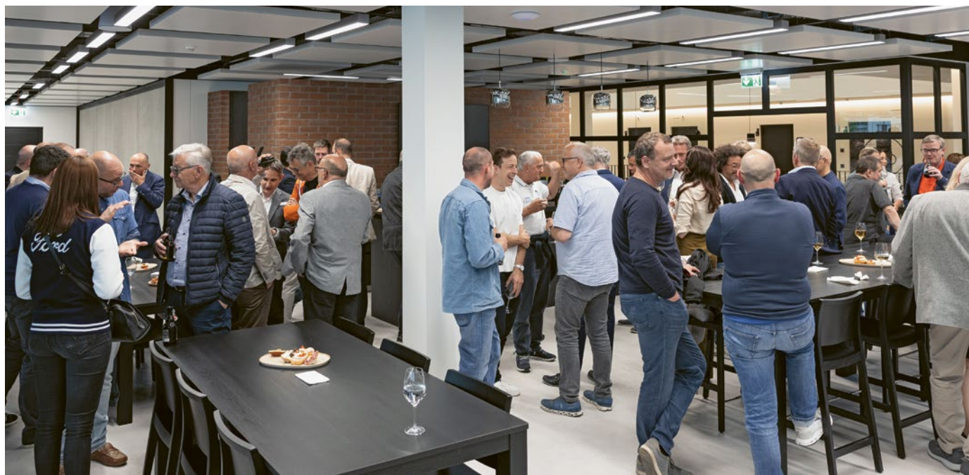
Die Jahresversammlung förderte den persönlichen Austausch und die Vernetzung innerhalb der liechtensteinischen Wirtschaft.