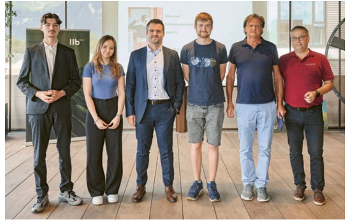
Ehrung der Verbundpartner Simconex und Junic durch die LLB-Vertreter.

Parallel dazu starteten im Betriebs-Coaching 37 Lernende in insgesamt 20 Betrieben. Der Rekrutierungsprozess ermöglichte die Ausschreibung von zehn Lehrstellen in der Verbundlehre sowie 40 Lehrstellen im Betriebs-Coaching,