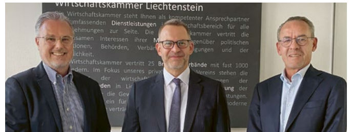
Austausch mit S.E. Robert Lauer, Botschafter des Grossherzogtums Luxemburg, zu aktuellen wirtschaftlichen Themen und Herausforderungen.

Mitgliedern einen einfachen Zugang zu relevanten Informationen, Merkblättern und aktuellen Themen und stellt eine wichtige Ergänzung zur persönlichen Beratung dar.