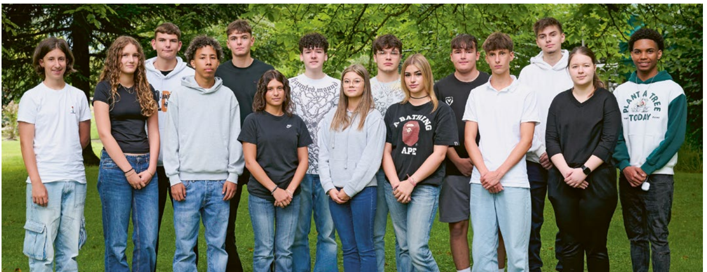
Unsere 16 neuen Lernenden, die in sieben verschiedene Lehrberufe gestartet sind (Sportlernender fehlt).

Das Berichtsjahr verdeutlicht eindrücklich, dass unser Dienstleistungsbereich einen wesentlichen Beitrag zur erfolgreichen beruflichen Integration junger Menschen leistet. Durch enge Kooperationen, gezielte Fördermassnahmen und die flexible Reaktion auf gesellschaftliche Veränderungen sichern wir gemeinsam mit unseren Mitgliedsunternehmen die Qualität und Zukunftsfähigkeit der Berufsbildung in Liechtenstein.