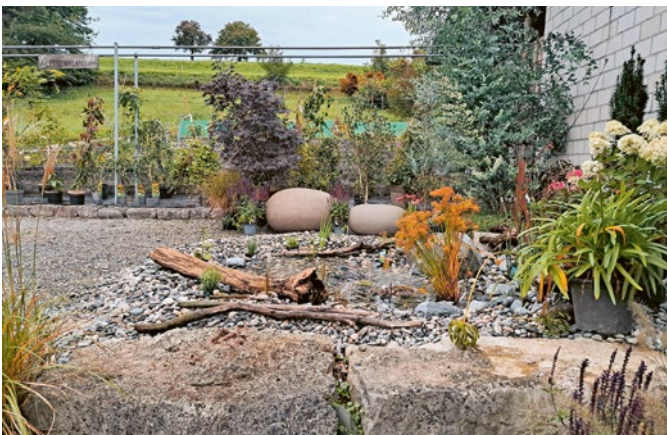
Bei der Müko Gartengestaltung in Mauren stand das Thema «Wasser im Garten» im Mittelpunkt.

«Auf zum Blühpunkt 2025!» hiess es am 13. September, als fünf heimische Garten- und Floristikbetriebe gleichzeitig ihre Türen öffneten. Mit viel Hingabe und Leidenschaft stellten die teilnehmenden Betriebe ihre Arbeit vor, gaben faszinierende Einblicke in ihre täglichen Aufgaben und begeisterten die Gäste mit kreativen Ideen sowie praktischen Tipps. Besonders beliebt war der Wettbewerb, der Jung und Alt zum Mitmachen einlud und für zusätzlichen Spass sorgte. Jeder Betrieb präsentierte ein zentrales Thema – von der Bedeutung von Wasser im Garten über Baumpflege bis hin zu Vorträgen über Nützlinge und Pflanzenstärkung. Ein wahres Highlight des Gärtner- und Floristenverbandes, das künftig alle zwei Jahre stattfinden soll.