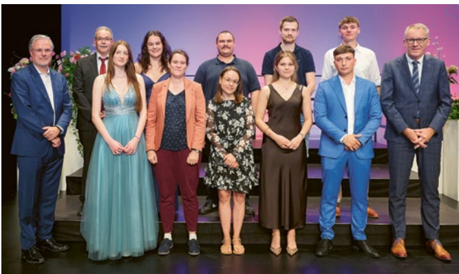
Die erfolgreichen Absolventinnen und Absolventen mit Eintrag ins Goldene Buch wurden an der Lehrabschlussfeier 2025 besonders gewürdigt.

Ein besonderes Zeichen für die Bedeutung der Berufsbildung setzte die Lehrabschlussfeier 2025 im Vaduzer Saal. Insgesamt 135 Absolventinnen und Absolventen aus rund 25 Berufssparten konnten an diesem Anlass ihren erfolgreichen Abschluss feiern. Die Veranstaltung würdigte nicht nur die individuellen Leistungen der jungen Berufsleute, sondern stellte zugleich die zentrale Rolle der dualen Ausbildung für den Wirtschaftsstandort Liechtenstein dar.