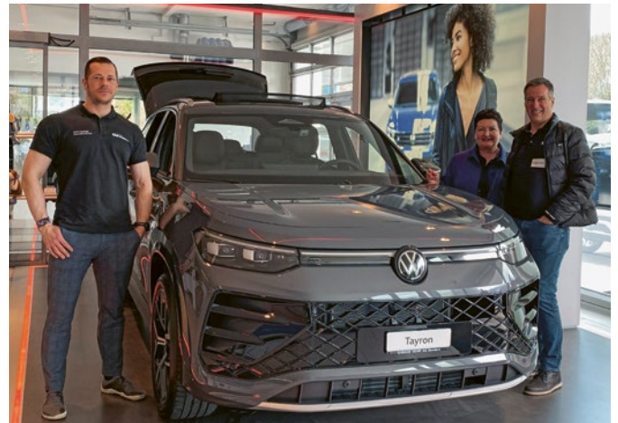
AutoLie 2025 – Heimische Garagen zeigten aktuelle Modelle und Marken.

Der GIL-Jahresapéro hat sich längst als eine bedeutende Veranstaltung im Gewerbe etabliert. Am 5. Mai lud die Sektion «Gewerbliche Industrie Liechtenstein» in die Braustube in Schaan ein. Unter dem Titel «Nachfolgelösung für KMU – und was hat Jonathan damit zu tun?» beleuchteten Vertreter aus Politik und Wirtschaft die Herausforderungen und Erfolgsfaktoren eines gelungenen Gene-