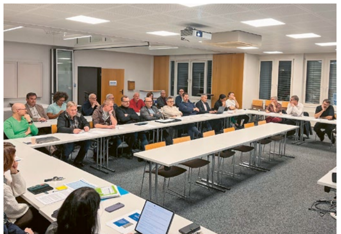
Die Präsidentenkonferenz ist neben der Jahresversammlung das wichtigste Gremium der Wirtschaftskammer.

Im Jahr 2025 traf sich das Gremium zu 4 ordentlichen Sitzungen in den Räumlichkeiten der Wirtschaftskammer. Geprägt waren diese Sitzungen u.a. durch die Neuwahlen