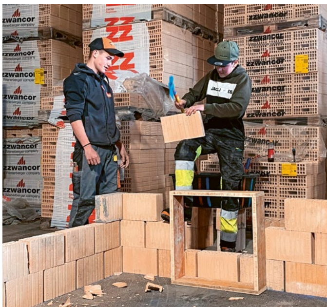
Beruf zum Anpacken - Ein Schüler entdeckt den Maurerberuf während der BerufsCHECK-Woche.

Die BerufsCHECK-Woche ist ein fester Bestandteil der Berufsorientierung in Liechtenstein – und war auch 2024 wieder ein voller Erfolg. Vom 11. bis 15. März hatten über 300 Schülerinnen und Schüler der 8. Klassen die Gelegenheit, in rund 70 verschiedene Lehrberufe hineinzuschnuppern. Organisiert von der Wirtschaftskammer Liechtenstein und der liechtensteinischen Industrie- und Handelskammer bot die Projektwoche eine einzigartige Möglichkeit, zahlreiche Lehrberufe hautnah kennenzulernen.