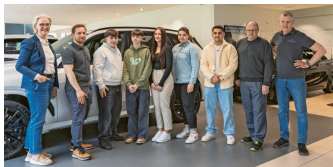
Max Heidegger AG mit den neuen Lernenden.

Im Dezember betreuten wir in 34 Betrieben 74 Lernende. Für das kommende Jahr sind 33 Lehrstellen im Auftrag unserer Betriebe ausgeschrieben.