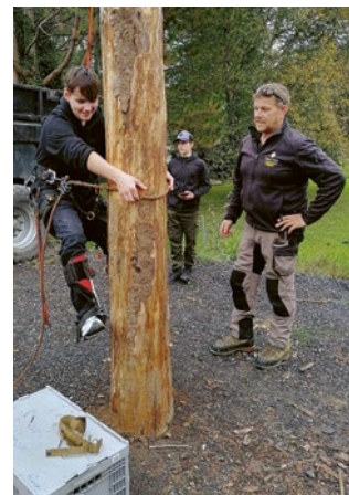
Schüler bekommen die Berufe vorgestellt.

Mit einem Stand waren wir im Herbst zudem an den Next-Step Berufs- und Bildungstagen mit dabei.