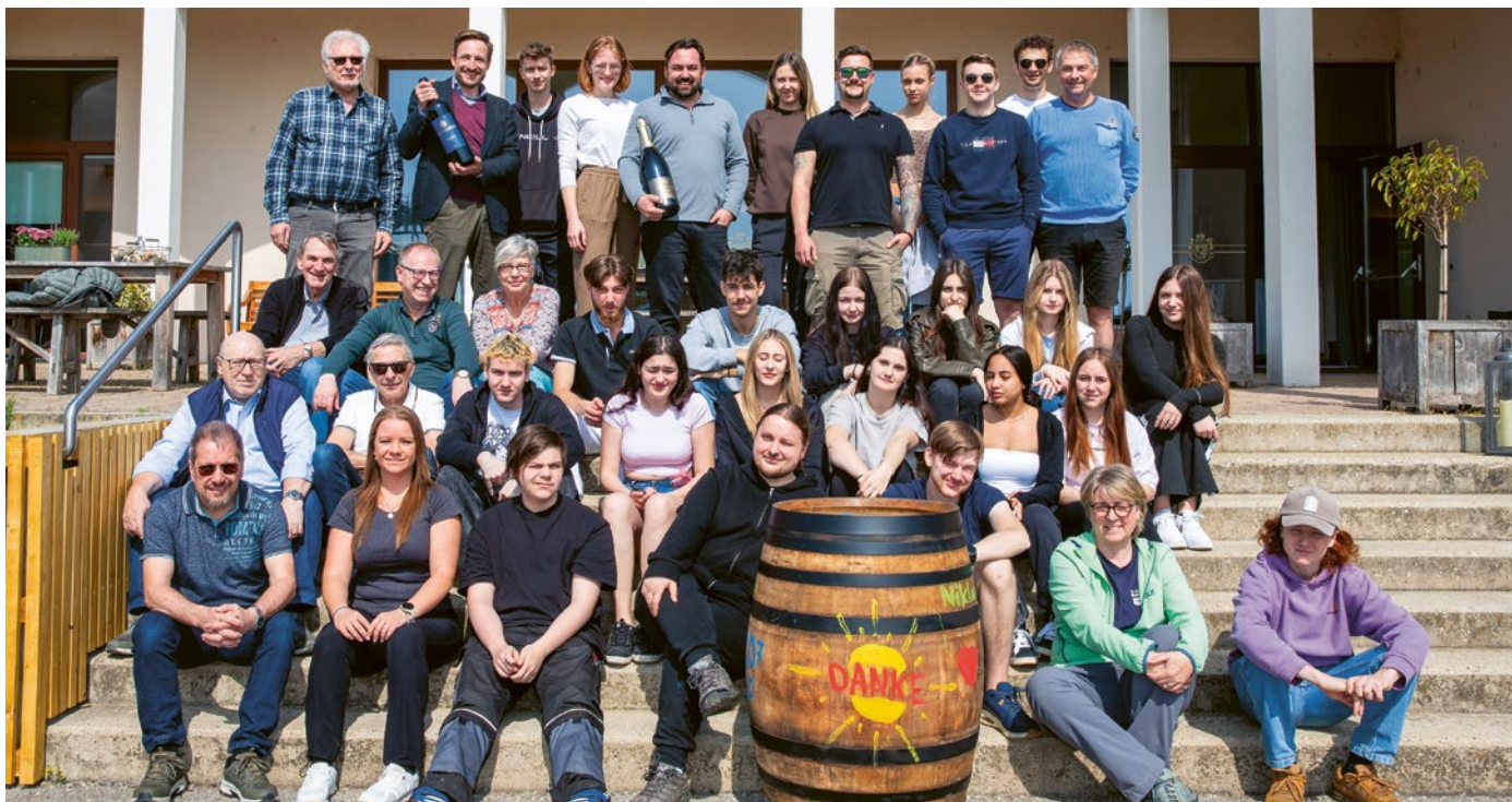
Gruppenbild 100pro! und Alumni der Wirtschaftskammer in Wilfersdorf.

Alle 12 Verbundlernenden haben im Sommer ihre Lehre erfolgreich abgeschlossen und verfügen über eine Anschlusslösung. Die Ausbildung erfolgte in folgenden Betrieben: