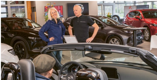
AutoLie 2024 - Heimische Garagen zeigten aktuelle Modelle und Marken.

Am 23. und 24. März luden 13 heimische Garagenbetriebe zur gemeinsamen AutoLie-Ausstellung ein und präsentierten