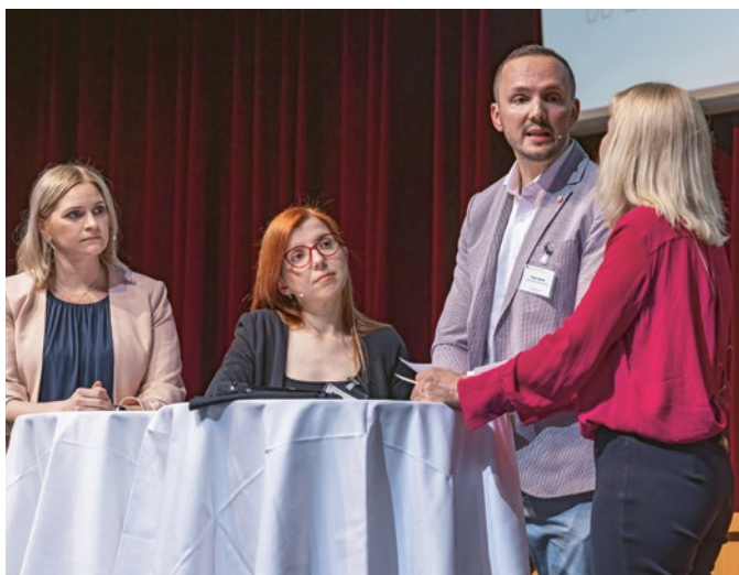
Die Podiumsteilnehmerinnen und -teilnehmer im Gespräch mit der Moderatorin zum Thema «Familie und Beruf».