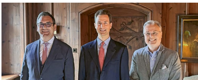
Höflichkeitsbesuch auf Schloss Vaduz.

Im Mai 2024 wurde der scheidende und neue Präsident der Wirtschaftskammer von S.D. Erbprinz Alois von und zu Liechtenstein zu einem Höflichkeitsbesuch und Arbeitsgespräch auf Schloss Vaduz empfangen. S.D. Erbprinz Alois von und zu Liechtenstein