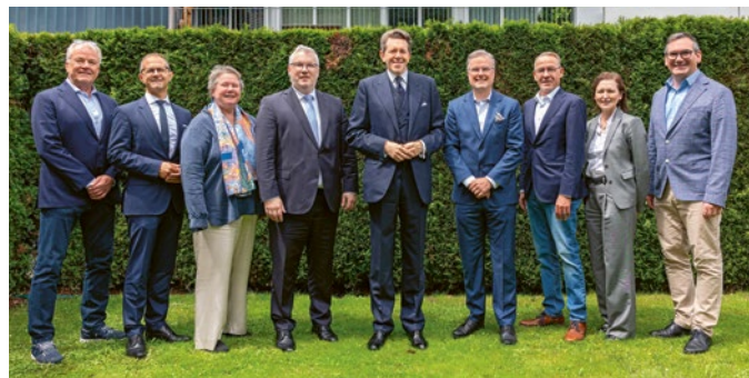
Die Wirtschaftskammer Liechtenstein durfte mit grosser Freude den Präsidenten der Wirtschaftskammer Österreich zu einem freundschaftlichen Informationsaustausch in Liechtenstein begrüßen.

Der regelmässige Austausch mit Vertreterinnen und Vertretern aus Politik und Wirtschaft – auch über die Landesgrenzen hinaus – ist der Wirtschaftskammer ein zentrales Anliegen. In diesem Rahmen fanden auch 2024 wieder verschiedene Begegnungen mit Delegationen und Gästen aus dem In- und Ausland statt. Der persönliche Dialog fördert das gegenseitige Verständnis, stärkt die grenzüberschreitende Zusammenarbeit und bietet wertvolle Impulse für die Weiterentwicklung wirtschaftspolitischer Themen.