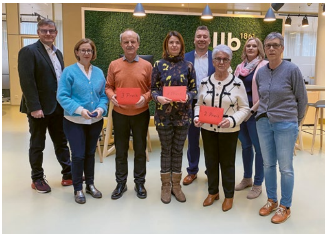
Die 5 Hauptpreise wurden im Rahmen einer kleiner Feier im Hauptsitz der LLB übergeben.

Auch die Gutscheine von «einkaufland liechtenstein» sind nicht mehr wegzudenken – sie werden gerne als Geschenk oder zu Jubiläen gekauft.