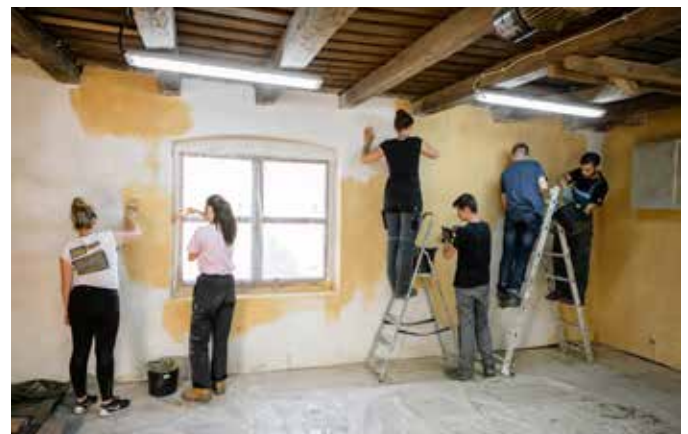
Insgesamt 21 Lernende von 100pro! berufsbildung liechtenstein haben während einer Woche den Instandsetzung mitgearbeitet.

Auch das traditionelle Unternehmerforum fand seine Fortsetzung. Im April nahmen 23 Unternehmer am Forum in Innsbruck teil. Neben Firmenbesuchen konzentrierte sich das 3-tägige Seminar auf das Thema «Cyberattacks und digitale Strategien». Fachkundige Referenten aus Liechtenstein, der Schweiz und Österreich, brachten ihre Erfahrungen ein und begeisterten die Teilnehmer mit ihren Vorträgen. Abgerundet wurde das Seminar mit dem Besuch von Wirtschaftsminister Dr. Daniel Risch, welcher die geplanten Digitalisierungsprojekte sowie die automatisierte Mobilität der Zukunft vorstellte.