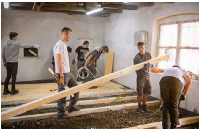
Die Lernenden engagierten sich tatkräftig beim Innenausbau der Schreinerei.

konnte auch eine neue Zusammenarbeit für das Jahr 2018 vereinbart werden. Ein Projekt mit Zukunftscharakter; die KMU-Unternehmer Akademie, gemeinsam von der Wirtschaftskammer, kurse.li und dem Bündner Gewerbeverband als neue Weiterbildungsplattform für gewerbliche Unternehmer lanciert, wurde im Herbst 2018 gestartet. Mit Erfolg, der Kurs war restlos ausgebucht!