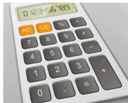
Jahresrechnung 2018. Seite 18–19