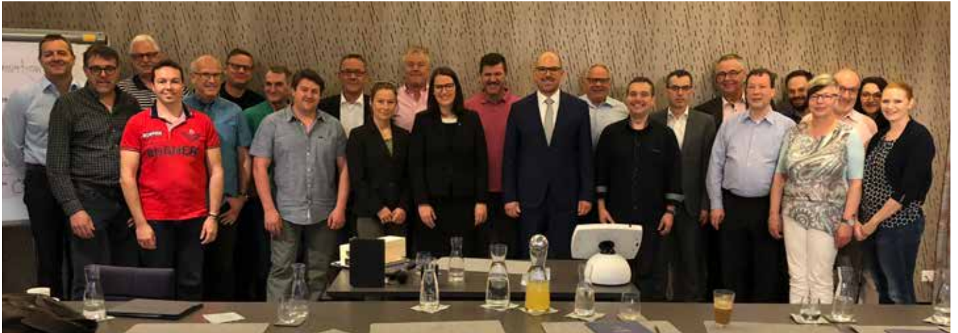
Im April 2018 wurde wieder das erfolgreiche Unternehmerforum von kurse.li durchgeführt.

einer fachspezifischen Veranstaltung der Sektion proIT im Herbst 2018. Im Herbst fanden innerhalb der Sektionen Neuwahlen statt, an welchen es auch mehrere neue Gesichter bzw. Unternehmer in den Vorständen gegeben hat. Ein herzlicher Dank an alle Personen, welche nach langjähriger Verbandstätigkeit nicht mehr zur Verfügung stehen, aber auch ein Dank an alle neuen Funktionäre für die wertvolle Arbeit zum Wohle des Gewerbes.