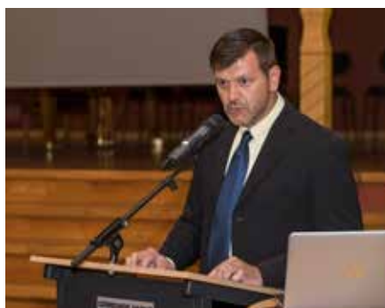
Jahresbericht 2018. Seite 3–10