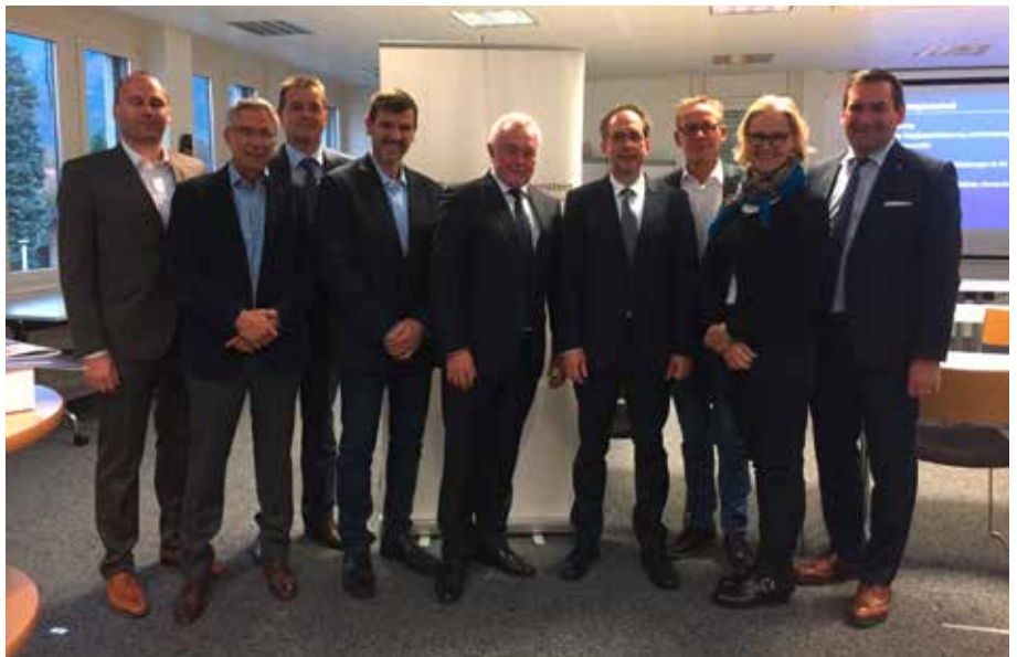
Die Teilnehmer des Unternehmer-Talks mit dem Vizepräsidenten des Deutschen Bundestags, Wolfgang Kubicki.

Fortgesetzt werden sollen der Ausbau der Dienstleistungen für die Mitglieder sowie die Werbung für die Gewinnung neuer Mitgliedsunternehmen. Ein waches Auge wollen wir auch im neuen Jahr auf die Regulierungen und Richtlinien werfen, die Liechtenstein von Brüssel aus erreichen. Geprüft werden sollen insbesondere die Notwendigkeit sowie die Grössenverträglichkeit der daraus entspringenden Gesetze und Verordnungen. Fortgesetzt wird das Bestreben, einen weiteren Abbau der Bürokratie, die hinderlich für die gewerbliche Wirtschaft ist, zu erreichen. Im Fokus stehen wird ausserdem die Bewältigung des drohenden Fachkräftemangels. Zu den grössten Herausforderungen gehört die Bereitstellung wirtschaftsfreundlicher Rahmenbedingungen, generell für die Wirtschaft und insbesondere für das Gewerbe. Gefordert werden in diesem Zusammenhang stabile Unternehmenssteuern und fi-