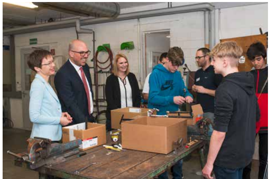
Wirtschaftsminister Dr. Daniel Risch besucht im Rahmen der BerufsCHECK-Woche die Ospelt Haustechnik AG und informiert sich vor Ort über die angebotenen Ausbildungsberufe.