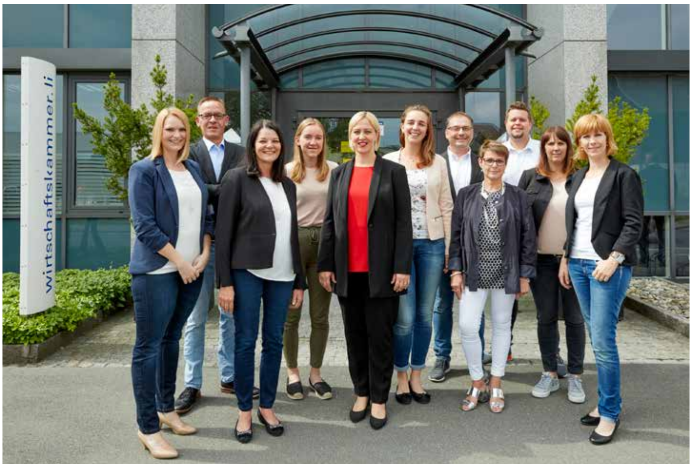
Das Team der Wirtschaftskammer Liechtenstein.