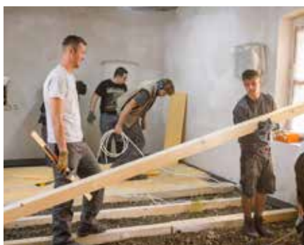
Sektionsberichte 2018. Seite 11–17