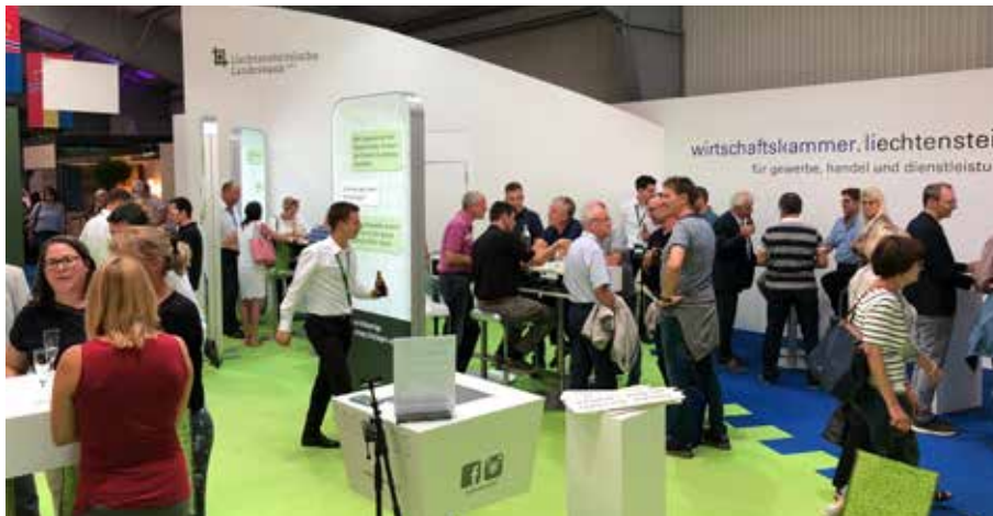
Der gemeinsame LIHGA-Auftritt stösst bei den Besuchern auf grosses Interesse.