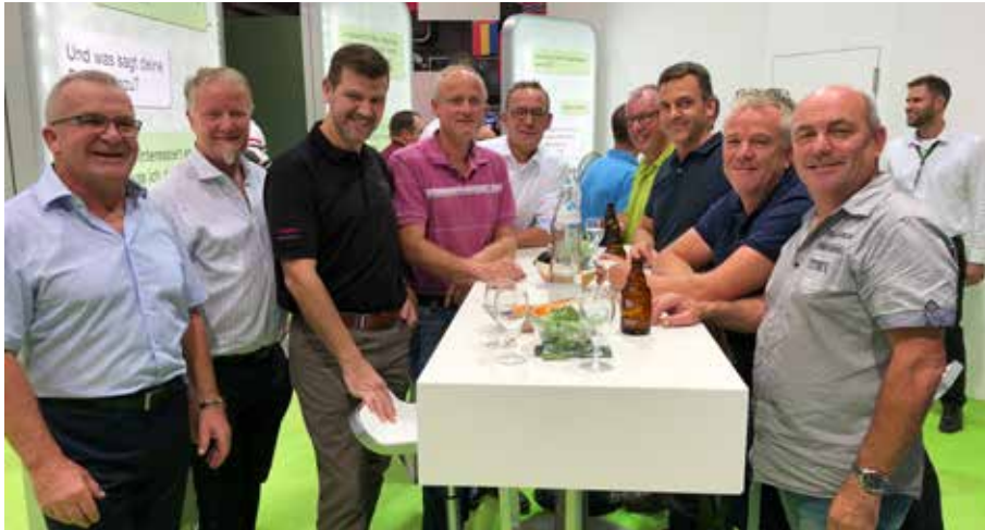
Präsidentenrunde am LIHGA-Gemeinschaftsstand der Wirtschaftskammer Liechtenstein und der Liechtensteinischen Landesbank.